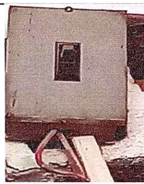
Instalación interna y externa de energía eléctrica.