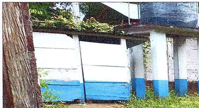
Se necesita cambio de madera a block en baños.