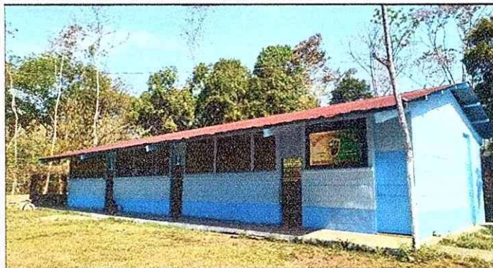
La escuela necesita cambio de lámina.