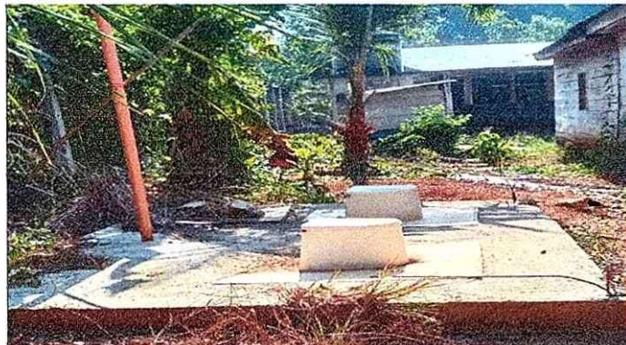
Se necesitan paredes, cambio de terraza de baños, puertas y techo.